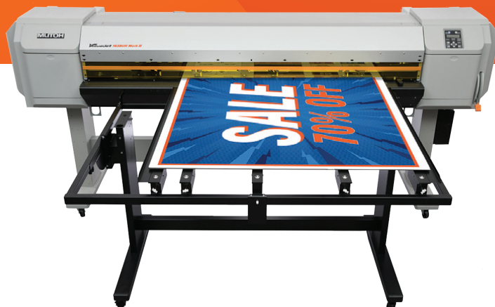
ValueJet 1638UH Mark II