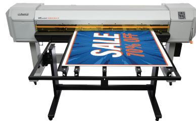
ValueJet 1638UR Mark II